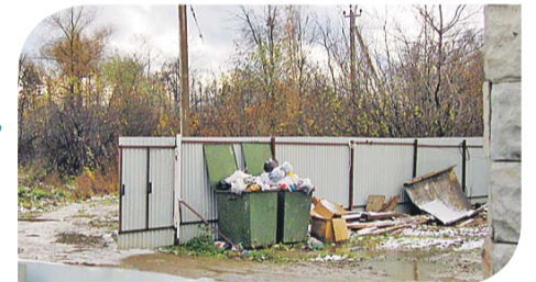
Мусор дожидается вывоза, собирая крысы

туют по принципу сообщающихся сосудов. Физику не обманешь, воде и другим жидкостям под землей не укажешь, куда им течь. А это значит, что в один далеко не прекрасный день окрестные колодцы могут оказаться отравлены соляркой. Да ладно бы, если колодцы. Соседи не могут дознаться, какова же глубина скважины. Но подозревают, что она значительно глубже, чем мелкие 30-метровые «песчанки». Скважины малой глубины дают слабый приход воды, такого с трудом хватает даже на одну семью. Чтобы воды было достаточно, бурить в наших краях нужно ниже 100 метров. Речь уже о воде Московского артезианского бассейна, всегда находившейся под особым контролем. Это не шутки.