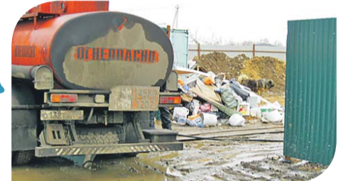
Заправка соляркой дизельной котельной