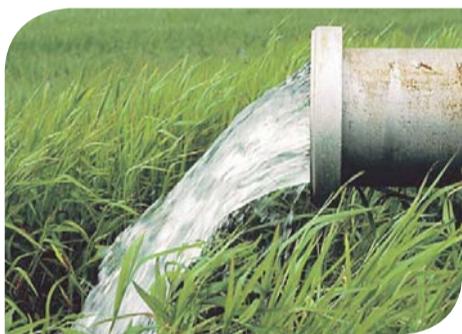
Сброс вод из септика идет на грунт

Два года назад наша газета уже поднимала вопрос о строительстве многоквартирных домов на землях, предназначенных под садоводство или индивидуальное жилищное строительство (статьи «Налетай, покупай трехэтажный сарай», «Дачный домик на два десятка квартир»). Первая из них, размещенная в интернете на сайте odinews.ru , стала темой ожесточенной полемики сторонников и противников подобной застройки. Вот уже два года не стихают словесные перепалки, посетителями оставлено почти 1300 комментариев. Судьбу «дачного домика» близ платформы Здравница мы обещали проследить и рассказать о ней читателям. Выполняем обещание - хотя историю с ним пока еще нельзя считать завершенной.