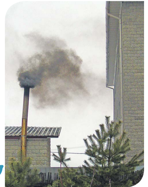
Ветер несет гарь и копоть в окна соседских дач